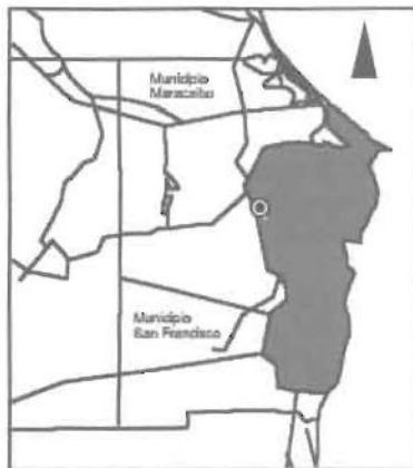
Localización del área de estudio

La comunidad de este barrio posee valores de servicio, solidaridad, compromiso, unidad familiar e interés en la formación y preocupación por adquirir los valores fundamentales para la vida, a partir de su compromiso como cristianos.