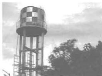
Tanque elevado del acueducto HIDROBARRIO

El agua se extrae mediante una bomba convencional que la envía a la superficie y a su vez a un depósito elevado ubicado a 12 metros de altura con respecto al nivel del terreno; posteriormente ésta es distribuida por gravedad a la red del barrio. El recorrido del agua desde el pozo se hace a través de una tubería que permite acercar horizontalmente lo más posible el líquido al tanque elevado. En ese momento la tubería se adosa a una de las columnas estructurales que soporta el tanque elevado hasta alcanzar la altura necesaria para llenarlo.