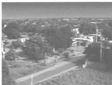
Vista aérea del Barrio Rafael Urdaneta

“El valor fundamental de esta experiencia es pedagógico ya que aquí se han utilizado métodos no convencionales para el logro de la meta planteada. En muchos proyectos se habla de la educación popular; yo me río de eso, porque no se interpreta realmente lo que es la educación popular; resulta que usted tiene un paso de camino y ese es el paso de la educación, y uno se educa dentro de ese paso. Tú no puedes cambiarle ese paso a la gente; entonces tú dices: ¿Cómo, manteniendo el grado de organización que cada uno tiene, puedes incorporarlo al trabajo comunitario? -Se dice que el pueblo no está organizado, yo digo que sí lo está, pero a su manera porque trabajar, cocinar, limpiar la casa, jugar ver televisión, etc.; es decir, que de alguna manera el pueblo tiene su tiempo organizado, ocupado. Cualquier cosa adicional que tú quieras hacer que no esté contemplada dentro de lo que tú estás acostumbrado a hacer, supone de una habilidad de tú metértele y enamorarle para encargarle esa otra actividad, sin que deje de ser lo que él es. Es algo así como interpretar lo que dice la Biblia; ¡Agarra tu cruz y sígueme!, no le está diciendo a uno ¡Deja tu cruz y agarra la mía! ; está diciendo agarra la tuya y vente conmigo. Es una interpretación evangélica que tiene que ser