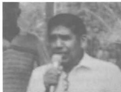
Día de la inauguración del acueducto HIDROBARRIO