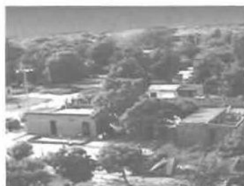
Vista aérea del barrio Rafael Urdaneta