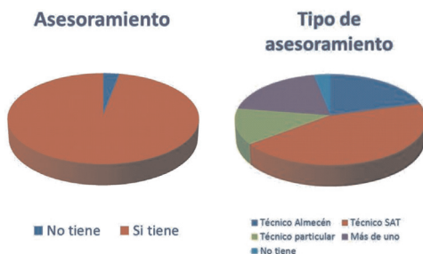
Figura 4. Porcentajes de distribución del uso y tipo de asesoramiento.

El asesoramiento técnico es mayoritario pues un 97% de los agricultores son visitados por técnicos que les asesoran en el manejo del cultivo. El 43% son asesorados por técnicos de la sociedad comercializadora, un 20% por técnicos de almacenes de abonos y/o fitosanitarios donde estos agricultores adquieren estos productos, un 13% por técnicos particulares, un 19% tienen más de un técnico que les asesora y 2% otros (Figura 4).