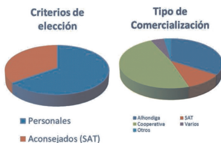
Figura 2. Porcentajes de distribución de los criterios de elección de tipo de cultivo y de comercialización.

El elevado número de agricultores que comercializa en alhóndigas es debido a que el perfil del agricultor que vende en la alhóndiga es aquel propietario de fincas de tamaño medio de 1,9 hectáreas (agricultores de fincas de pequeñas dimensiones) que quieren sentirse independientes. No obstante, la estrategia empresarial del empresario alhondiguista se ha modificado considerablemente en los últimos años. Se ha pasado de ser meros intermediarios, cuyo objetivo era vender el género en el propio establecimiento y al mercado interior, a una orientación más empresarial y sobre todo sin perder la idea de exportar (Valenciano y Pérez Mesa, 2002).