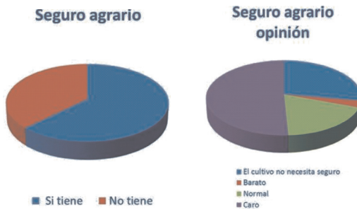
Figura 5. Porcentajes de distribución del seguro agrario y opinión.

La opinión de los agricultores sobre el seguro agrario es variable, así un 3% considera que es muy barato o barato, un 18,5% que es normal, 44,5% que es caro o muy caro. El 37% no tiene seguro de los que el 28% opina que no es necesario y 9% que es muy caro (Figura 5).