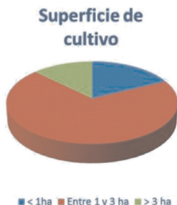
Figura 1. Porcentajes de distribución de la superficie de cultivo.

Casi el 70% de las explotaciones tiene una superficie comprendida entre 1 y 3 hectáreas (Figura 1). Los agricultores que tienen menos de 1 hectárea representan el 17,8% y los de más de 3 hectáreas el 12,7%. El pequeño tamaño de las explotaciones implica que en la provincia de Almería se da una agricultura familiar, no existiendo grandes empresas agrarias.